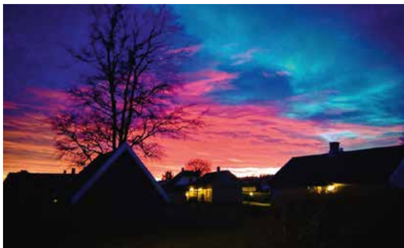
Gundersens vei. Tekst: Kveldsstemming fra Gundrosens vei.