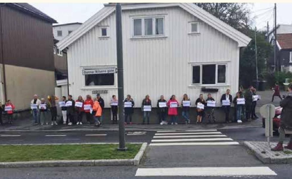
Dialogforum tok initiativ til en bønnering rundt Masjid Darussalam-moskeen i Gunnar Nilsens gate 4, under motto: «trygg i bønn» i september 2019.