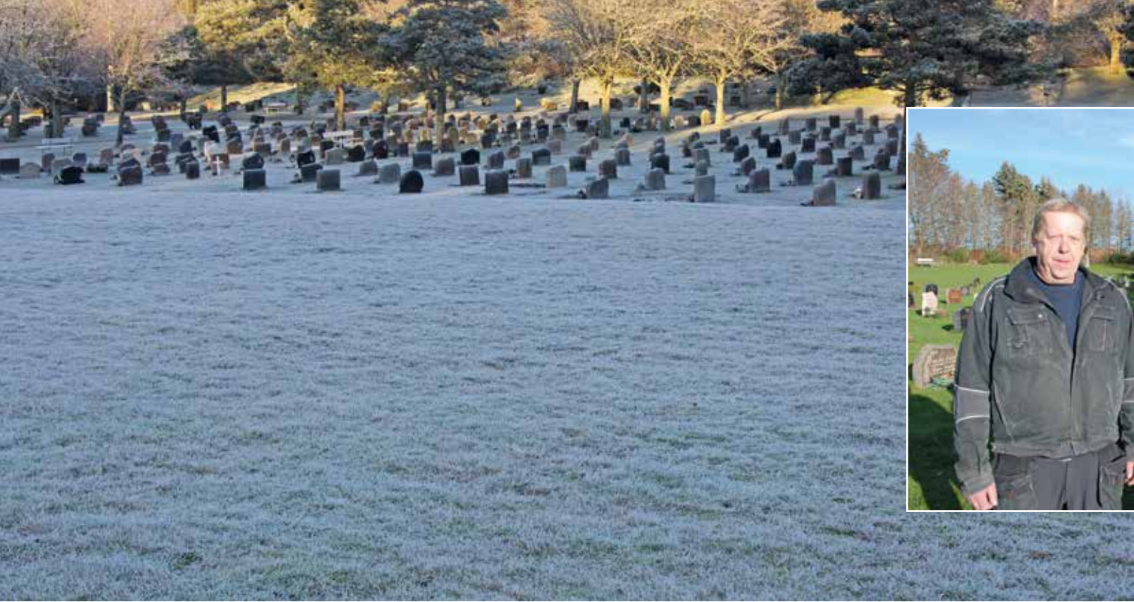
Leie gravlund i vinterskrud, med rim og frost på bakken.

MENIGHETSBLADET HAR BESØKT LEIE GRAVLUND OG VESTRE FREDRIKSTAD GRAVLUND