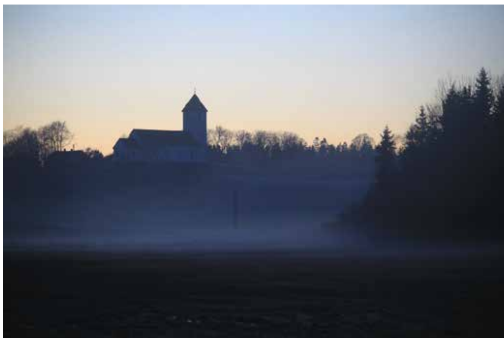
Borge kirke.

– Glemmen kirke er symbolet på at byen har vokst og kommuner er slått sammen. Kirkegården lager en grønn lunge midt i byen. Spannende at en av landets ruvende arkitektskikkelser, Arnstein Arneberg, har tegnet den. Her er et flott tårn, som trapper seg oppover i fire nivåer – på den litt ekstravagante måten som kjennetegner Arneberg. Et tønnehvelvet tak og modernistiske fresker på veggene bak og over alteret gir kirkerommet en egenart.