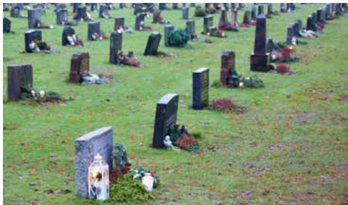
Mange lys å se ved gravstøttene på Vestre gravlund julaften 2019.

Gravlundene i kommunen har en egen maskingruppe på tre medlemmer, som følger godt med på nye maskiner. Vi er nødt til å ha smidige maskiner, det er stor forskjell på å klippe gresset på en fotballbane og en kirkegård, sier Fürst og legger til at en gang i året drar kommunens kirkegårdsansatte på park-anleggsmassen på Lillestrøm for å se nærmere på alle de nye maskinene som tilbys i markedet.